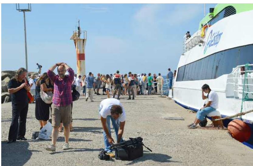
Ψάχνοντας για τη σκιά

Κατά τη διάρκεια του φεστιβάλ φιλίας που οργάνωσε το σωματείο ΔΑΦΝΗ μεταξύ Ίμβρου (στην Τουρκία) και Σαμοθράκης (στην Ελλάδα), ημέρα εκείνη και μόνο, πραγματοποιήθηκε για πρώτη φορά σύνδεση των δύο αναφερομένων νησιών με λεωφορείο θαλάσσης. Δυστυχώς όμως το προσωρινό τελωνείο που στήθηκε στην Ίμβρο μετατράπηκε σε ανυπέβλητο εμπόδιο. Δεν επιτράπηκε σε ορισμένους Έλληνες δημοσιογράφους και στους πανελίστες να επιβιβαστούν στο πλοίο. Ο πρόεδρος ε.π. Γιαλίμ Εράλπ, πρόεδρος του σωματείου Δάφνη, διαμαρτυρήθηκε για την κατάσταση, δήλωσε παραιτήση.