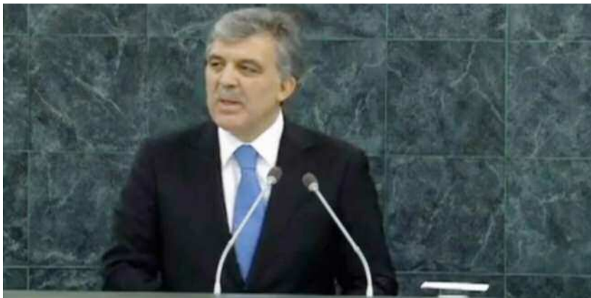
Στιγμιότυπο από την ομιλία του προέδρου Γκιουλ στην 68η Γενική Συνέλευση του ΟΗΕ.

Ήπιες αναφορές στο κυπριακό - που παρουσιάσε ως ζήτημα αξιοπιστίας της διεθνούς κοινότητας - περιείχε η ομιλία του προέδρου της Δημοκρατίας Αμπντουλάχ Γκιουλ, στη Γενική Συνέλευση του ΟΗΕ.