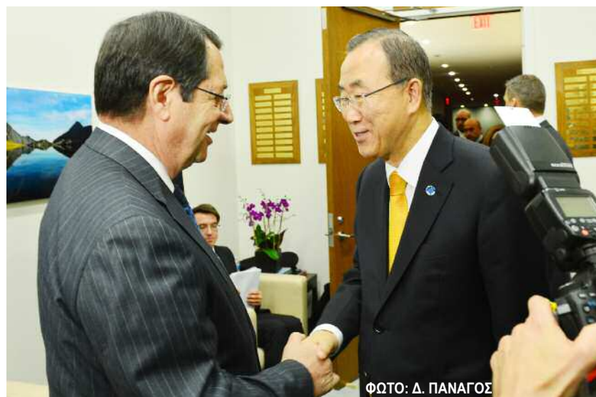
Ο Νίκος Αναστασιάδης συζήτησε με τον γ.γ. του ΟΗΕ Μπαν Κι Μουν.