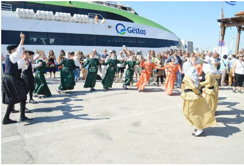
Οι σαμοθρακιώτες μας προαπάντησαν θερμά...

Όταν κατόπιν ονομαστικής κλήσης επιβιβάστηκαν στο πλοίο τόσο εκείνοι που είχαν έλθει από την Ίμβρο, όσο κι εκείνοι που έφθασαν στη Σαμοθράκη για συμμετοχή στο φεστιβάλ, διαπιστώθηκε ότι έμεναν κάποιον έξω. Μεταξύ αυτών υπήρχαν συμμετέχοντες από την